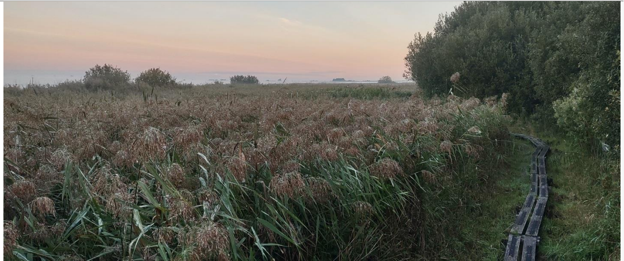
*Ondiepe mistbanken in de vroege ochtend, erg natte rietvegetatie (venebuurt, 07:27 uur)