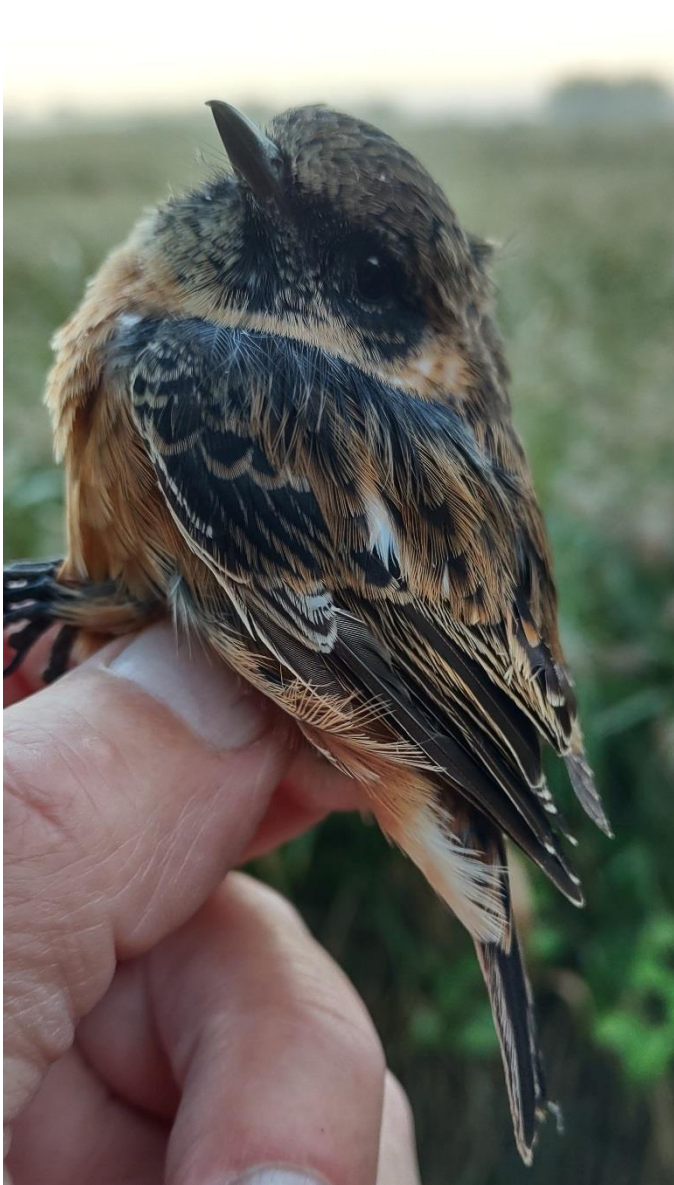
Roodborsttapuit, Venebuurt 22-09-2022